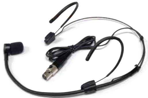
Headset condenser microphone